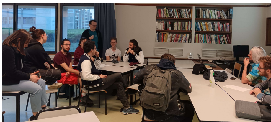
Événement de lancement de TelluZZEon